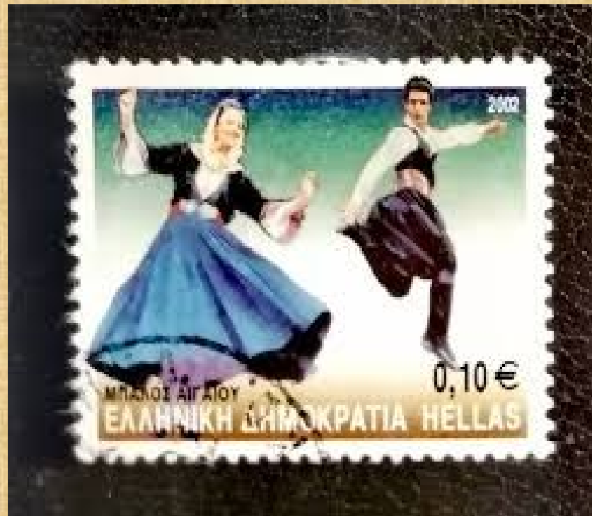
Ελληνικό γραμματόσημο με τον χορό Μπάλο